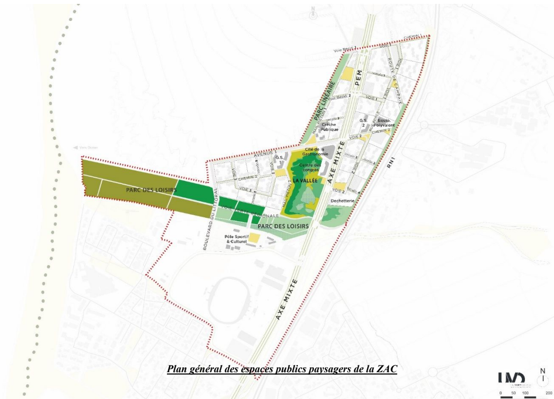
Plan général des espaces publics paysagers de la ZAC