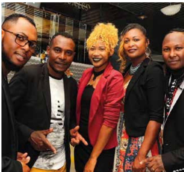
Le groupe Lumière