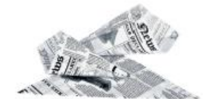
Cornet de papier journal