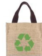
Sac en fibre