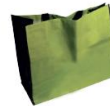
Sac et pochette