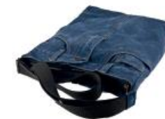
Sac en tissu ou fait main