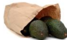
Sac en papier issu de forêts gérées durablement