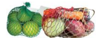
Filet de fruits et légumes