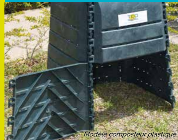
Modèle composteur plastique

Je récupère mon compost dans le bas du bac en retirant les planches de devant.