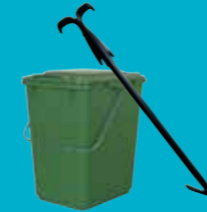
Bioseau et outil de retournement