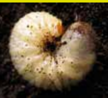
Larve de Cétoine