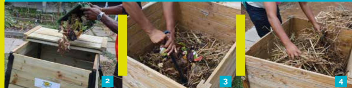
Modèle composteur bois