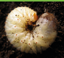
Larve de Cétoine