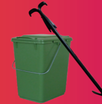
Bioseau et outil de retournement