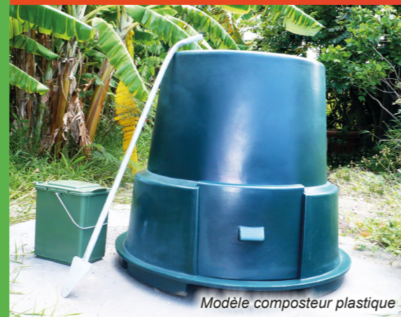
Modèle composteur plastique

Je récupère mon compost dans le bas du bac en retirant les planches de devant.