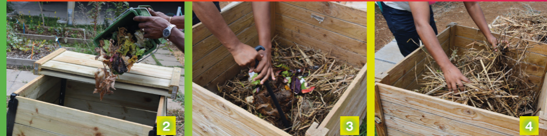
Modèle composteur bois