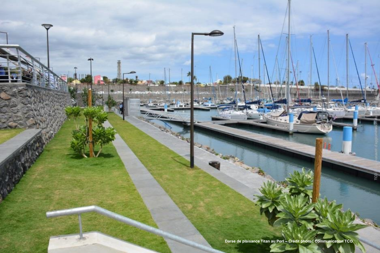
Darse de plaisance Titan au Port