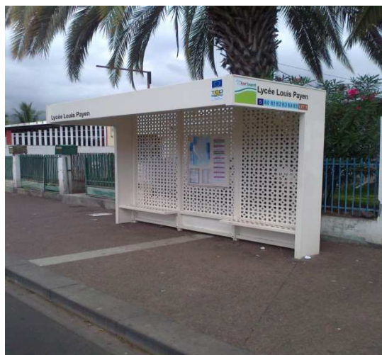
Photo 1. Arrêt de bus totalement accessible

Niveau d'accessibilité : "total" (quai accessible et continuité de trottoir accessible)