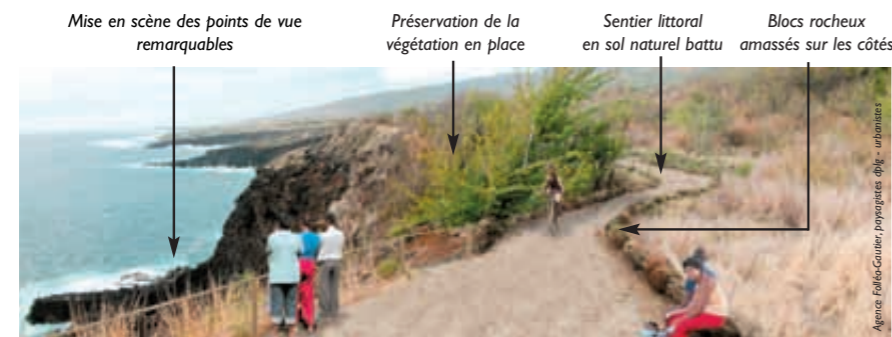
Proposition de principe